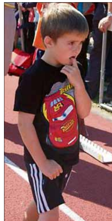
Bilder pd 50 m: Schaff ich das wohl?