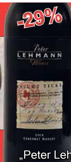
CABERNET MERLOT, WEIGHBRIDGE Australien 2008, 14.5%, 0.75l