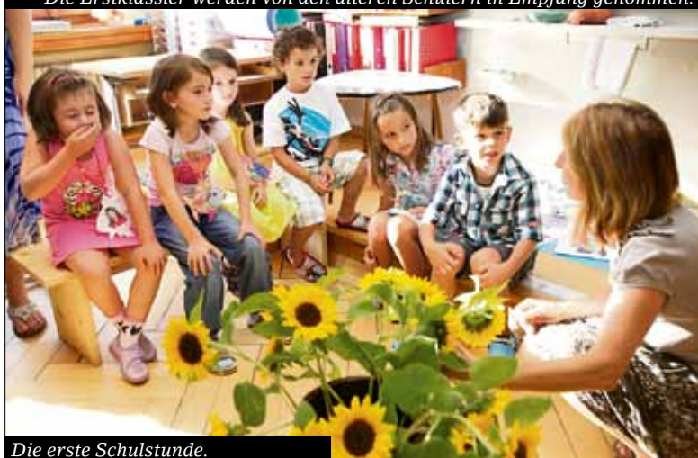
Die erste Schulstunde.

Im Schulzimmer gab es dann auch schon die erste Aufgabe zu erledigen, wie etwa das Gestalten der eigenen Namensschildchen. Dabei gab es schon sehr kreative «Würfe».