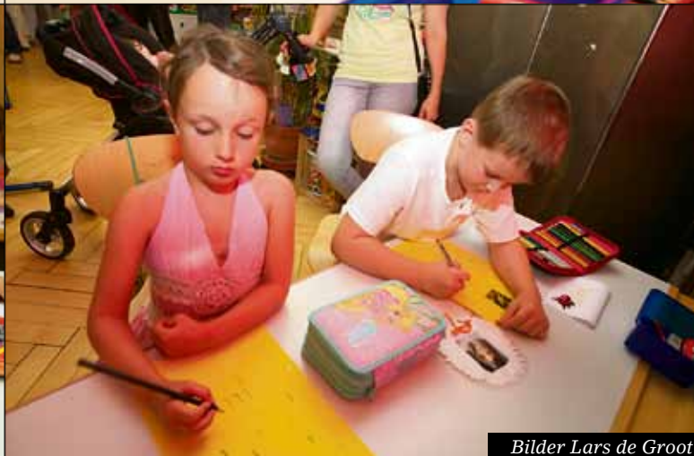
Bilder Lars de Groot