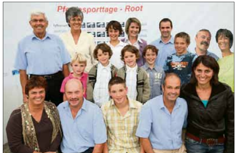
Das erweiterte OK Bucheli-Ruckli.

Gegen Hunger und Durst steht eine Festwirtschaft für jeden Gaumenwunsch zur Verfügung. Das OK der Pferdesporttage bedankt sich insbesondere bei den treuen Sponsoren und den vielen Helfern, ohne die ein solch tolles Turnier gar nicht möglich wäre. Hier