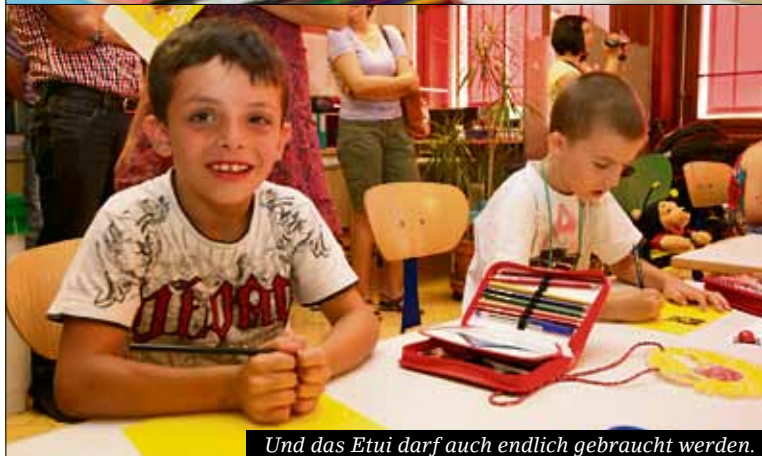
Und das Etui darf auch endlich gebraucht werden.