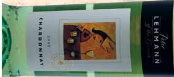
CHARDONNAY, BAROSSA VALLEY, Australien 2009, 11%, 0.75l

Wählen Sie aus über 350 Sorten Spitzenweinen aus aller Welt!