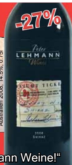
SHIRAZ, WEIGHBRIDGE Australien 2008, 14.5%, 0.75l