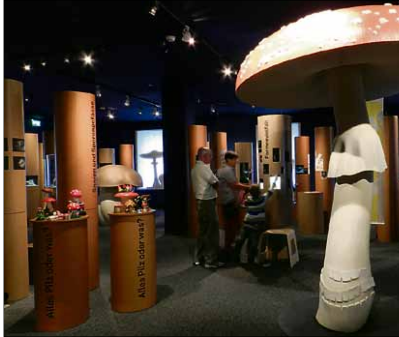
Blick in die Sonderausstellung «Pilzgeschichten».

Der Eintritt ist frei. Patronat der Führung: Freunde des Natur-Museums Luzern.