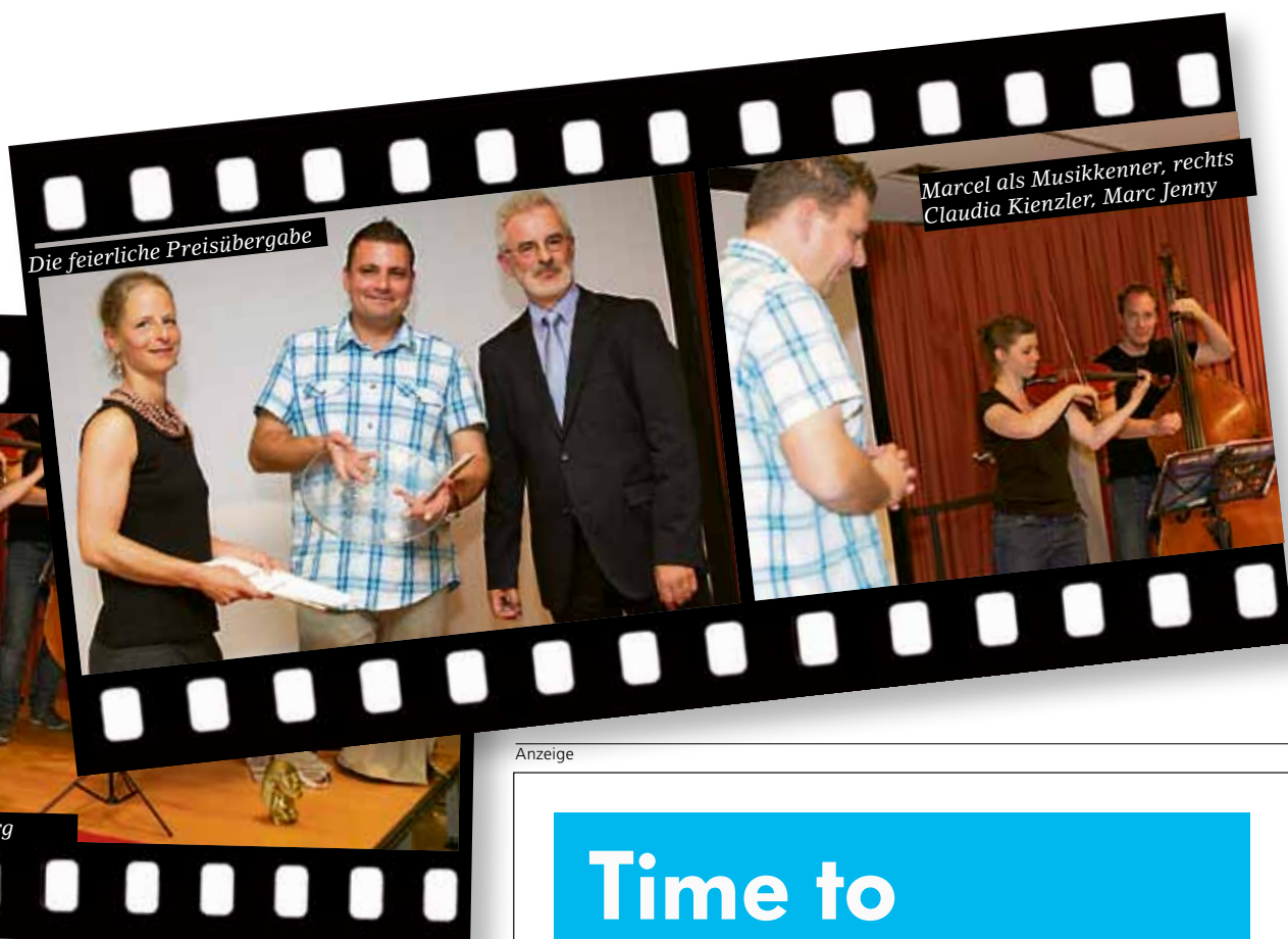
Die feierliche Preisübergabe