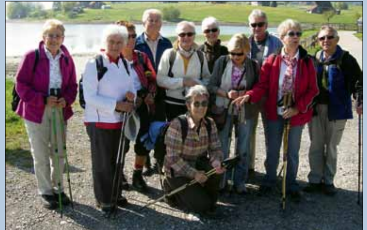
Pro Senectute, Senioren Aktiv Dierikon, Frauen Netz Ebikon, Gruppe Seniorenkontakte

pd./ro. Die Regionalpolizei Muri hat in den Monaten Januar bis März 2011 eine Geschwindigkeitskontrolle an der Luzernerstrasse durchgeführt. Die signalisierte Geschwindigkeit betrug 50 km/h. Von den 277 gemessenen Automobilisten waren 21 Prozent zu schnell. Die höchst gemessene Geschwindigkeit betrug 70 km/h.