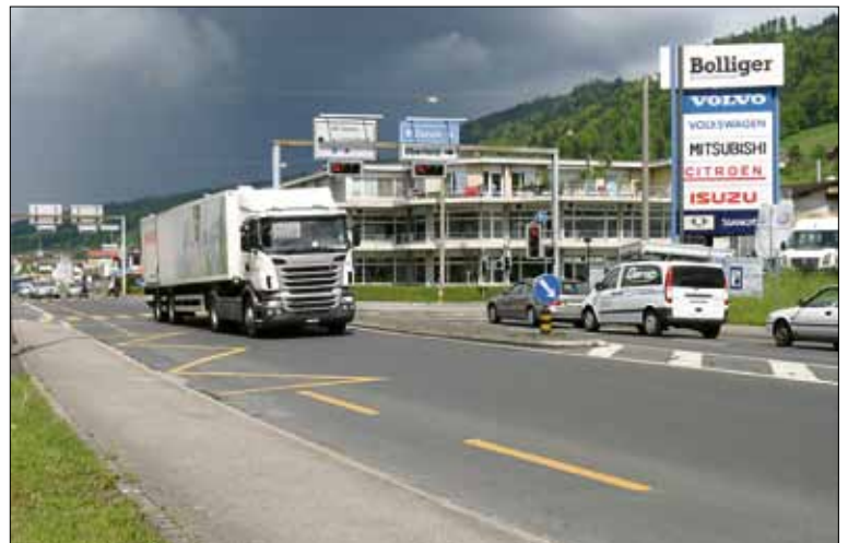
Auf dem Knoten Oberfeld in Root entsteht ein Kreisel.

Der Knoten Oberfeld in Root wird ab nächsten Montag, 17. Mai 2010 zu einem Kreisel umgebaut. Die Bauarbeiten werden in Etappen ausgeführt und dauern bis Dezember 2010.