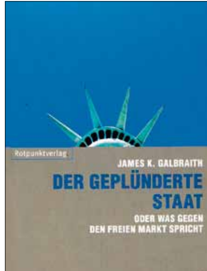
Der geplünderte Staat James K. Galbraith Rotpunktverlag ISBN 3-85869-417-1 Fr. 39.–

er als «Räuberstaat» bezeichnet. Ein System, in welchem private Akteure alles tun um aus staatlicher Wirtschaftsaktivität Profit zu schlagen. Sie plündern staatliche Gelder und stecken sie in private Taschen. Sie setzen sich für minimale Regulierung ein, um den Konsumenten noch mehr Geld abzuknöpfen; sie stellen sich gegen den Klimaschutz, weil dieser ihre Gewinne schmälern würde. Gibt es das nur im doch so weit entfernten Amerika? Die Warnung kommt jedenfalls vom Sohn von John Kenneth Galbraith, einem der einflussreichsten Ökonomen des 20. Jahrhunderts.