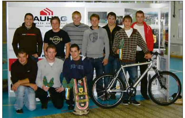
Die Nationalturner des STV Root nach dem Wettkampf.