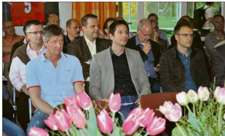
Interessierte Donatoren während der GV 2010 im Löösch.