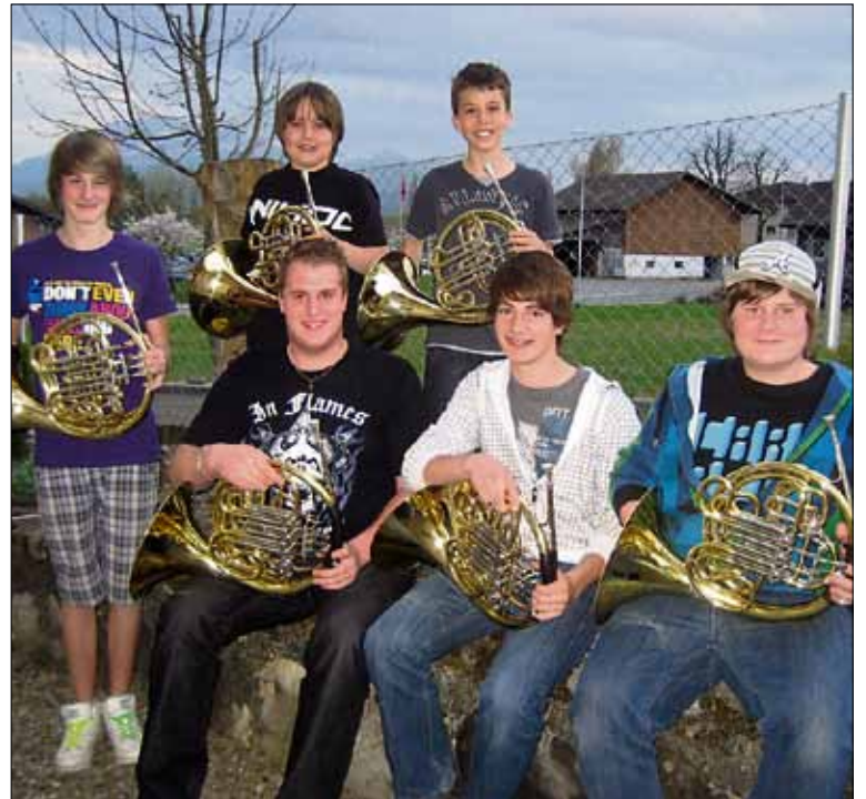
Die Waldhornisten der JMJ freuen sich auf das Treffen.