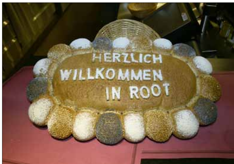
Ein gebackenes «Herzlich Willkommen» wartete auf die Neuzuzüger.

weise die Gründe eruieren, weshalb nach Root gezogen wird: Bezahlbare Wohnung und Bauland, Nähe Arbeitsplatz, zentrale Lage usw. Der erste Kontakt mit dem Personal der Gemeindeverwaltung wurde mit freundlich bis sehr freundlich beurteilt. «Verschiedentlich haben wir sogar konkretes Lob erhalten», resümierte Gemeindevorsteher André Wespi. Guten Anklang findet in Root auch das Informationsblatt. Einzelne kleine Verbesserungsvorschläge im Bereich des öffentlichen Verkehrs (öV) wurden mittels des Fragebogens ebenfalls an die Gemeinde herangetragen. Ansonsten wird der öV als gut bis sehr gut bewertet. Auf die Frage, was in Root vermisst wird, antworteten 15 Personen: Einkaufsmöglichkeiten, insbesondere eine Migros. Auf Anfrage bei