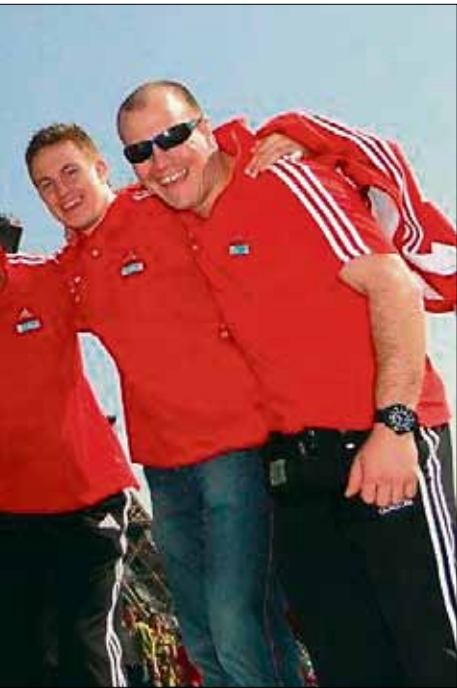
. von rechts) in Paris.