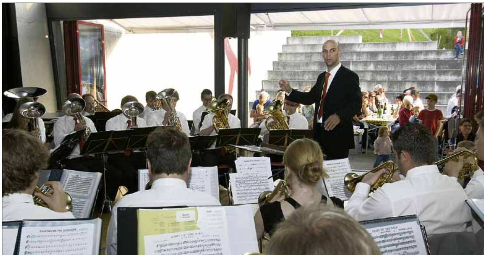
Die Brass Band Musikgesellschaft Root begeisterte mit ihrem Frühlingskonzert.