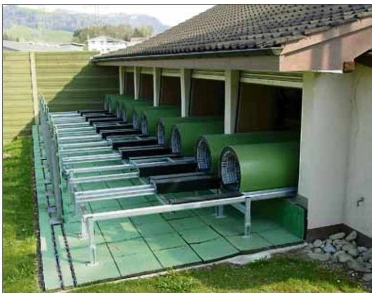
Ein Blick auf die moderne Schiessstunnel-Automatik.

Mit der aktuellen Totalsanierung der Schiessanlage wurde sowohl den Wünschen der Schützen wie den Anliegen der Bevölkerung vollauf Rechnung getragen. Für die Reduzierung des Mündungsknalls sorgt der Einbau von Schallschutztunneln. Um den Geschosknall Richtung Dorf Perlen in den Griff zu bekommen, musste eine 140 m lange